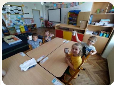
Třída mateřské školy na odloučeném pracovišti základní školy, šk. rok 2020/2021